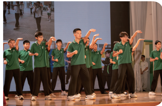
▲ 推動「一人一體藝」計劃，透過體藝陶冶學生的性情，協助建立具規律的課餘生活。