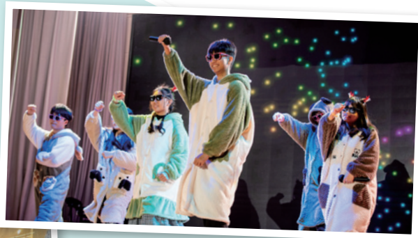
▲ 侯中老師讓每位學生享有愉快而優質的學習經驗，並為學生提供完善貼身的學習支援，安排不同的平台讓學生發揮所長，建立自信。