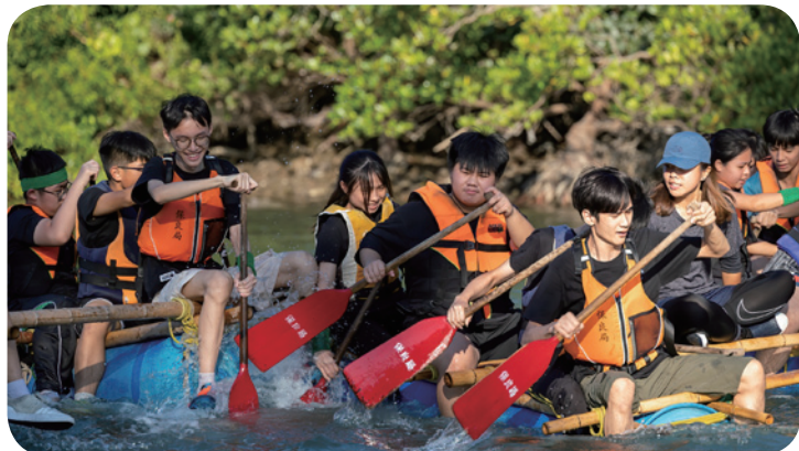
▲ 每年均舉辦領袖訓練營及中四級「成長訓練營」，以提升學生的溝通技巧、解難能力、領袖才能、團隊精神和抗逆力，以建立健康正面的自我形象。

與此同時，侯中在校內亦安排各級學生參與了「班際水上清潔機械人比賽」、「人工智能工作坊」和「探究不同遊戲中的勝出機會工作坊」等STEAM活動。為讓學生「走出課室」，侯中又安排了兩個「STREAM教育日營」（R = Recreation娛樂），帶領學生前往西貢白腊考察生態和地理，更上了一天「航空探索家課程」，寓學習於娛樂，使學生在各種STEAM的範疇上獲得全面而均衡的學習經驗。