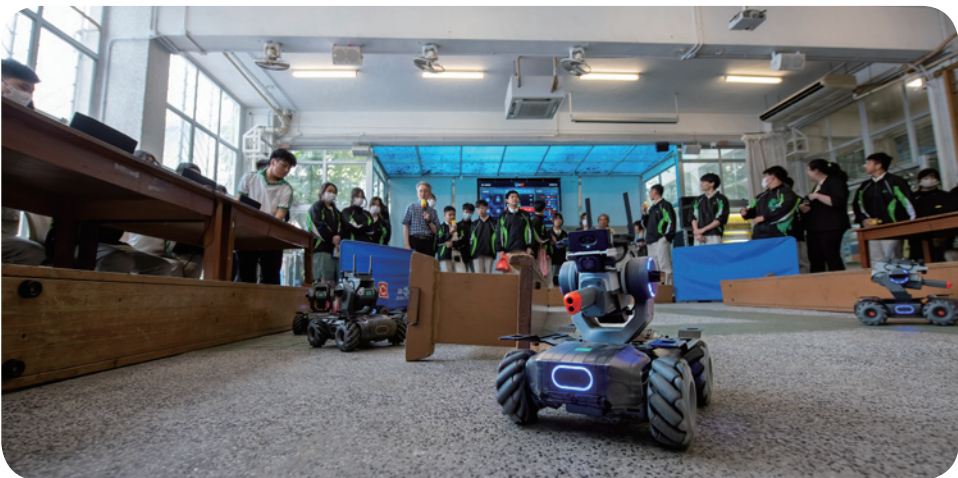
▲ 透過老師刻意營造充滿活力和互動的學習環境，藉此推動和促進學生學習，照顧不同的學習需要。圖為「機甲大師」的課程。

除了全面設計科學及科技教育課程提升學生的STEAM素養，侯中師生亦積極爭取機會讓學生實踐所學，近日侯中派出8位學生分2隊參加由香港城市大學化學系及香港化妝品化學師協會共同舉辦的「第四屆香港中學化妝品配方比賽」，是次比賽旨在提高中學生對化妝品科學的興趣，讓他們利用化學知識和實驗技術來開發新的化妝品配方。