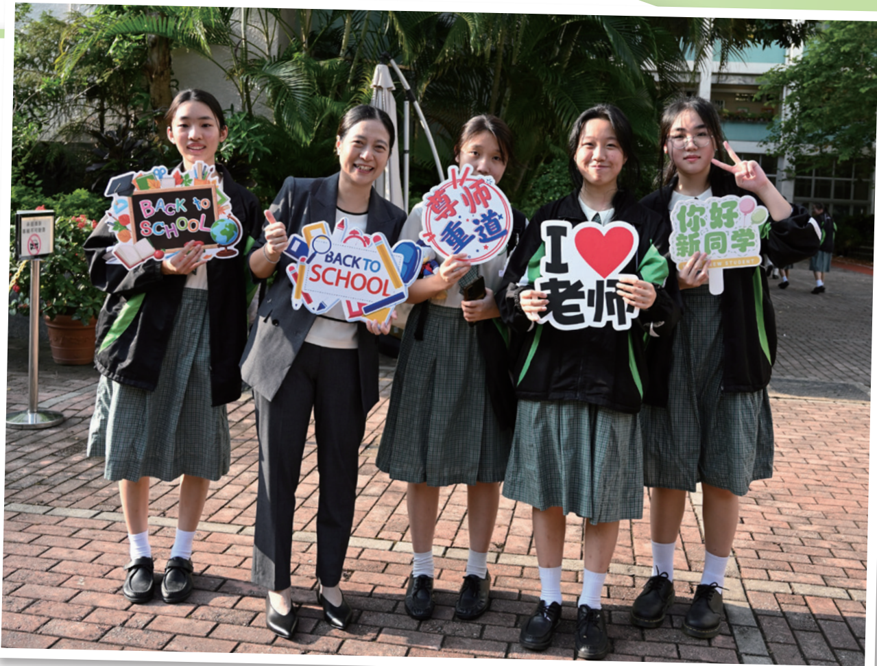
▲ 侯中深信所有學生都能夠透過學習，而達至學有所成，並盡展所能，促進全人發展。

▲ 推動「感動侯中」及「社區服務日」的校本社會服務計劃，每位學生均需投入不同的義工服務如：動物義工、探訪老人院及庇護托中心，以培養樂於助人的品德。